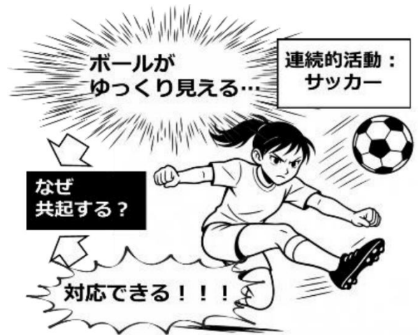
45 46 図1. フローにおける時間の拡張と能力の向上の共起。時間がゆっ 47 くり感じられると同時に、通常では対応できないような状況に対 48 応できるようになる。

43 こうした体験は私だけのものではない。Taylor 44 (2020; 2024) は、スポーツ場面において深く集中した